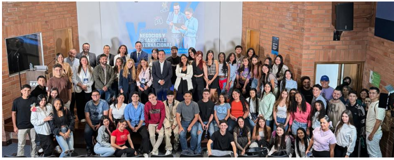
8 Mayo -Universidad EAFIT