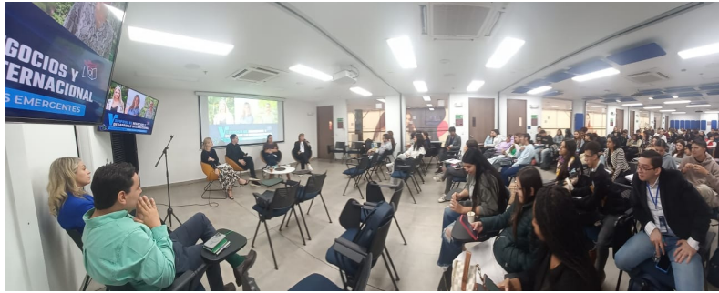
9 Mayo - Politécnico Grancolombiano