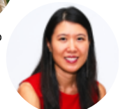
Sin Kit I