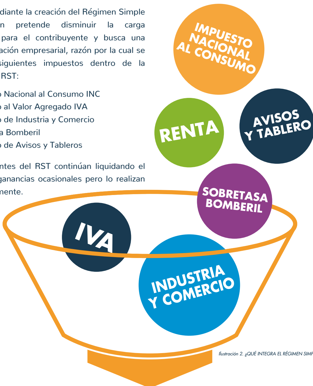
Ilustración 2. ¿QUÉ INTEGRA EL RÉGIMEN SIMPLE DE TRIBUTACIÓN?

Los contribuyentes del RST continúan liquidando el impuesto por ganancias ocasionales pero lo realizan independientemente.